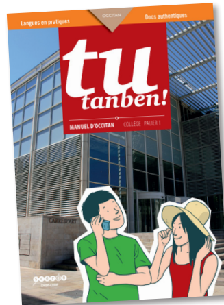
Manuel Tu tanben!

La progression indiquée dans la table analytique au début du manuel (pages 4 à 7) vaut donc pour les cahiers d'exercices. La photo qui sert d'entrée à chaque unité du livre est rappelée en tête de chaque chapitre du cahier.