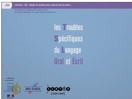
Document 3 : Page d'accueil

Le DVD-Rom s'ouvre sur la page d'accueil (document 3). On accède au menu en arbre ci-dessus en cliquant simplement sur n'importe quelle partie. À noter que le clic sur l'un ou l'autre des logos situés en bas à gauche permet d'accéder aux sites du ministère de l'Éducation nationale, de l'INS HEA et du SCÉRÉN. A priori , le DVD s'affiche en plein écran mais il peut être visionné et utilisé comme une fenêtre si on clique sur la touche « échap ».