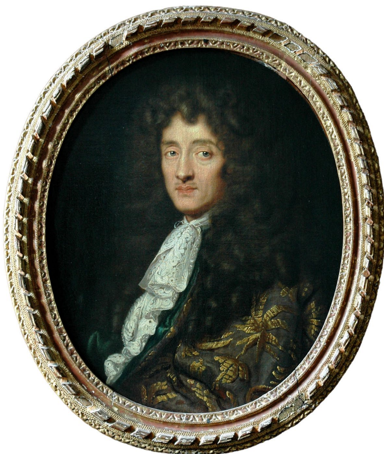
Jean Racine par François de Troy (1645-1730), Collection des Musées de Langres, Maison des Lumières Denis Diderot.