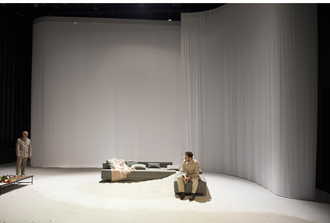
La scénographie, conçue par Guillaume Delaveau.

Proposition de mise en scène de l'exposé : aligner des chaises pour donner l'idée d'un grand canapé, les recouvrir de tissus, d'écharpes, de coussins gris clair et rose.