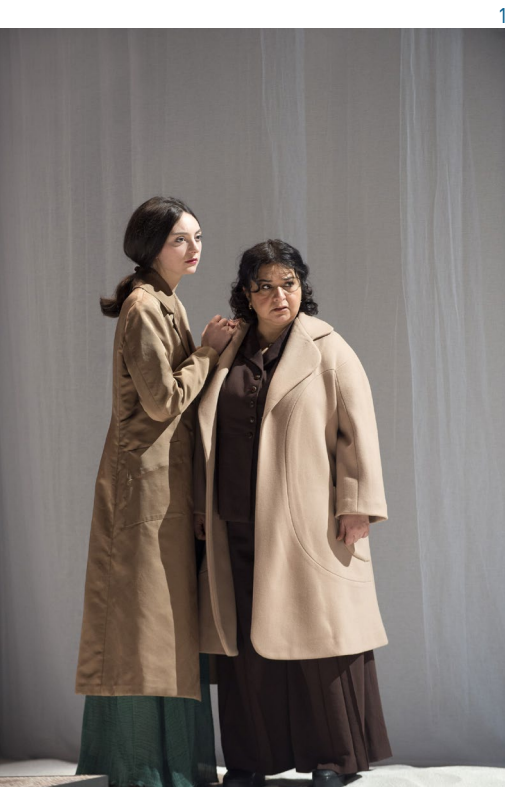
1 : Bérénice [Mélodie Richard] et Phénice [Mashad Mokhberi]. © Elizabeth Carecchio

Au dernier acte, toutes les deux portent un manteau au-dessus de leur costume indiquant qu'elles vont quitter Rome, partir en voyage.