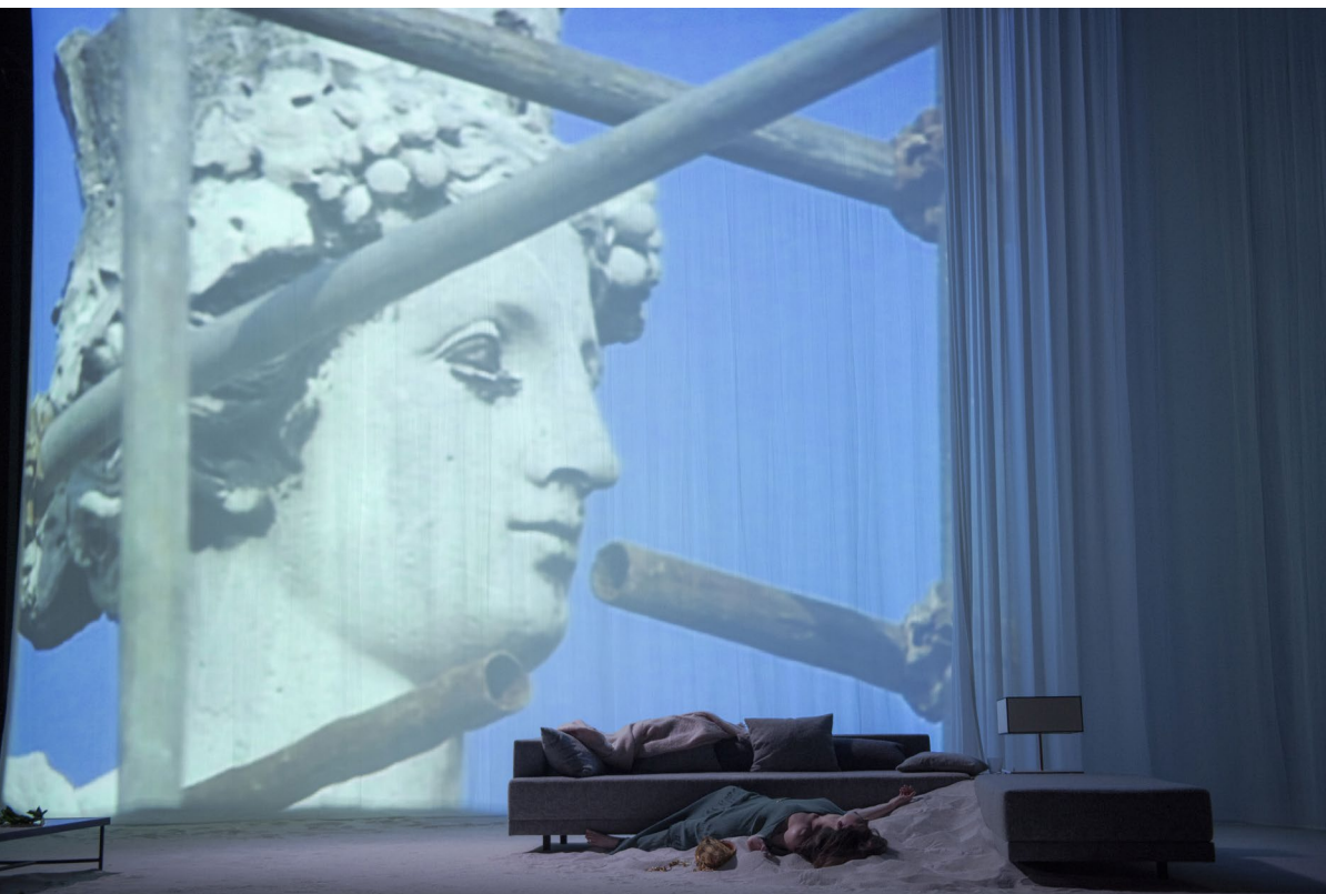
Cinéma et théâtre.

Ainsi diverses strates de temps, de lieux, d'influences sont-elles superposées, créant une sorte de chant polyphonique, conférant à cette mise en scène son identité et son originalité.