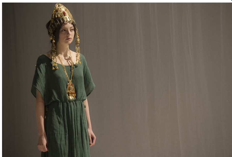
2 : Bérénice, reine de Judée.