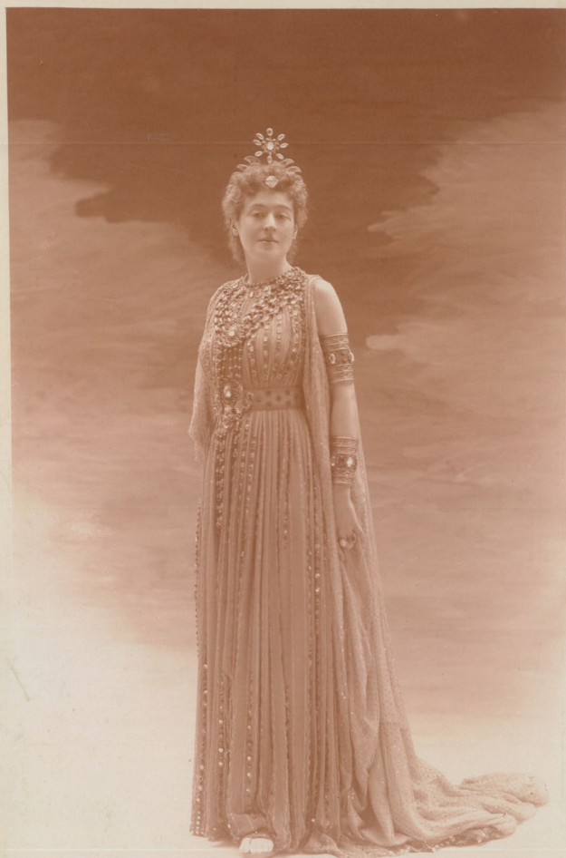
1 : Julia Bartet dans le rôle de Bérénice, Bérénice (Jean Racine), 1893, photographie Reutlinger, Acte III, 1893-94. Inv. 1743.