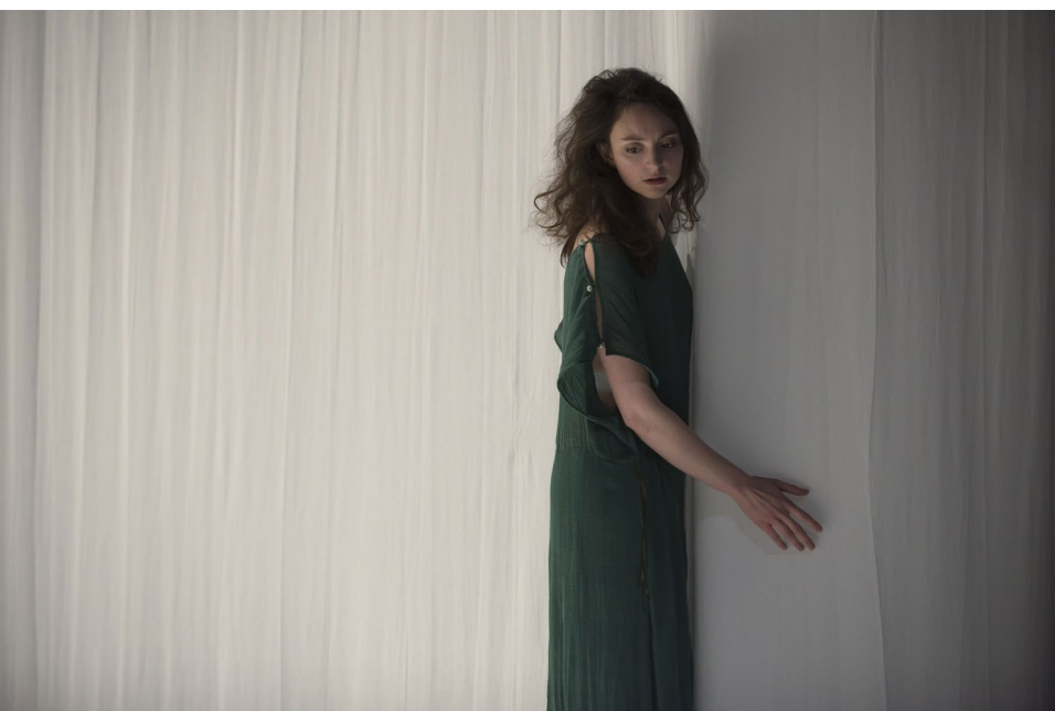
Voiles et lumière.

Pour la présentation : se placer devant ou derrière un voile selon qu'il est éclairé de face ou par derrière avec des lampes de téléphone, à condition de plonger la classe au préalable dans l'obscurité.