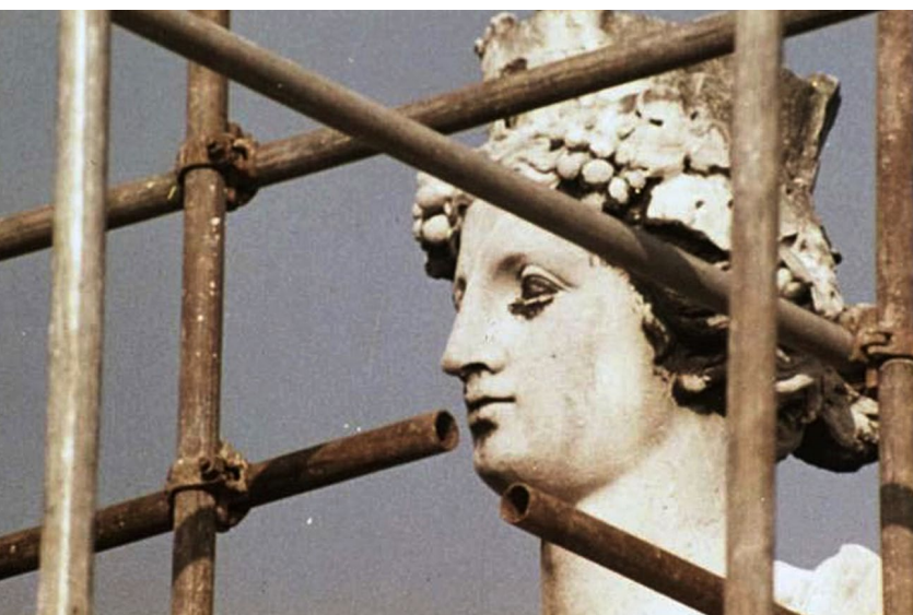
Image extraite du court-métrage Césarée , Les Films du Losange, 1979.

Ainsi, le son crée un effet de langueur, de nostalgie. Il installe un univers un peu fané, ancien, voire mystique.