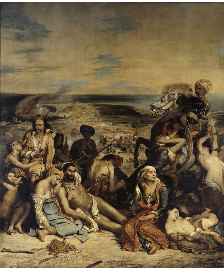
Eugène Delacroix, Scène des massacres de Scio : familles grecques attendant la mort ou l'esclavage , huile sur toile, 1824, Paris, musée du Louvre.

1. Se représenter le massacre d'un peuple : projeter aux élèves le tableau Scène des massacres de Scio , de Delacroix (perpétrés par les Ottomans contre la population grecque de l'île de Scio), leur demander de décrire ce qu'ils voient et leur ressenti.