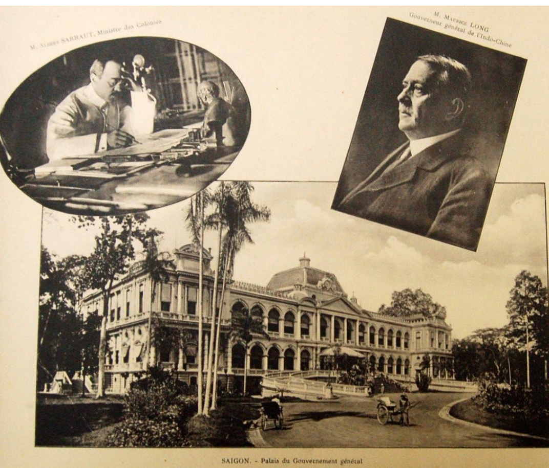
La ville blanche, carte postale ancienne, Saigon, Palais du gouvernement général.