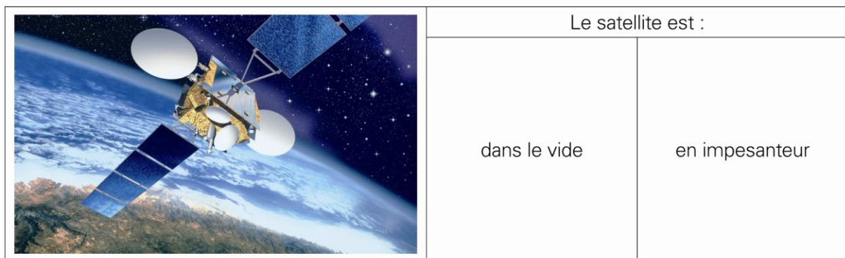
Illustration du satellite de télécommunication Telecom 2 - © CNES/ ill. David Ducros

Philippe PERRIN dans le laboratoire Destiny de la Station Spatiale Internationale (ISS) - © NASA, 2002