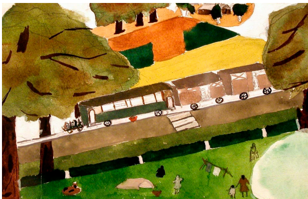
Arrêt d'un train de réfugiés pour quatre jours, 17 juin 1940. Inv. 1979.093249