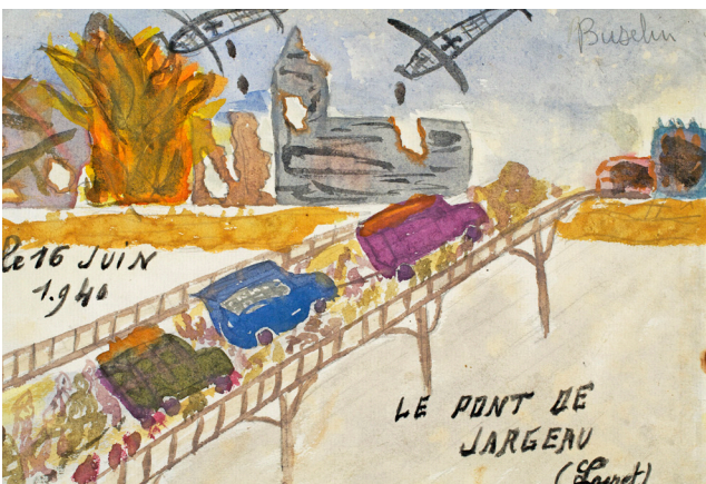
Le Pont de Jargeau (Loiret) le 16 juin 1940, 1940 Inv. 1979.09324.8

A la Renaissance , on peint la guerre en peignant la bataille : il s'agit d' illustrer pour raconter . Plus tard, ce seront les héros en action qui seront à l'honneur.