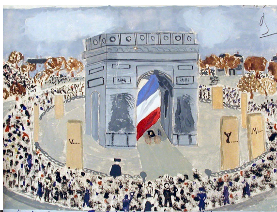
Défilé civil du 11 novembre 38, Expert, 1938 Inv. 1979.09400.19

• La « culture » de guerre qui imbibe une génération d'enfants, constituée d'adultes de demain.