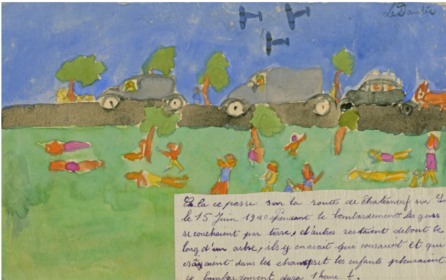
Scène d'exode à Chateaufort-sur-Loire (Loiret), 1940 Inv. 1979.09324.45