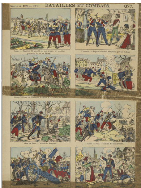
Batailles et combats. Guerre de 1870-1871, Ed. Pellerin et Cie, 1890 Inv. 1979.22671.2

L' imagerie d'Epinal , fondée en 1796, contribue à la construction d'un patriotisme fort, grâce au dessin : elle diffuse massivement une iconographie témoignant de la vaillance des soldats français lors de la 1 ère guerre mondiale. Ce sont de beaux jeunes hommes, revêtus d'un bel uniforme, souriants et toujours sereins, même dans la mort... Les souffrances sont réservées aux soldats allemands. Ces images ne montrent pas la guerre telle qu'est est, il s'agit de construire un imaginaire enfantin autour du soldat-héros.