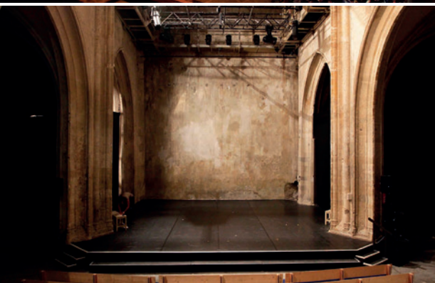
4: Le cloître des Célestins