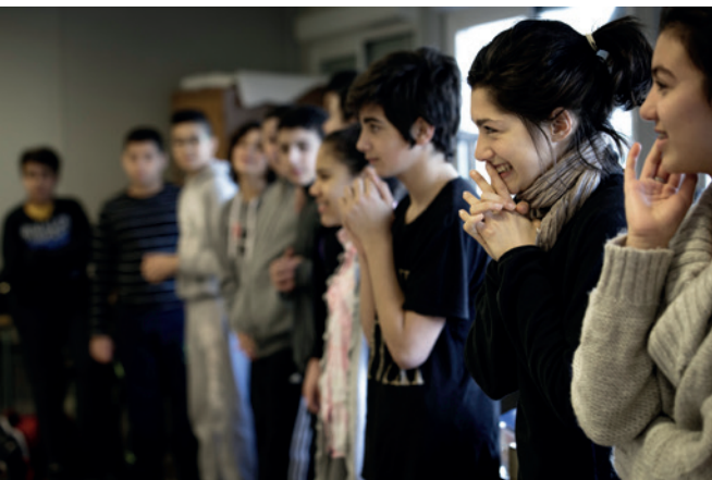
La république lit La République

Après la présentation des tableaux, discuter collectivement sur les dérives possibles du schéma du pouvoir représenté et sur les réponses, les « pare-feu », qu'on pourrait lui apporter.