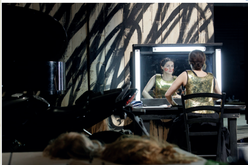
2 : Le Roi Lear