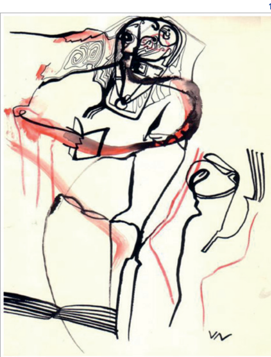
1 : Le Vivier des noms

Dans Richard III de William Shakespeare mis en scène par Thomas Ostermeier, la parole donne le pouvoir de manipuler l'autre pour le perdre soit en le rendant vaniteux, en le séduisant ; soit en faisant apparaître au grand jour sa part d'ombre, sa part de « mal » que nous portons tous et contre laquelle nous luttons pour pouvoir vivre en société. Le mot devient l'étincelle séductrice qui réveille le côté sombre de l'autre et l'entraîne, alors, dans une descente infernale.