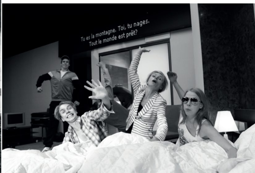
2: N051 Mu Naine vi hastas...