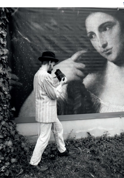
1: Trilogie du revoir © Benjamin Porée, Stanko Abadzic

À propos de N051 Ma femme m'a fait une scène et a effacé toutes nos photos de vacances , les metteurs en scène Ene-Liis Semper et Tiit Ojasoo affirment que « les moyens d'expression du théâtre contemporain permettent de communiquer au-delà de la langue ». Dans ce « spectacle sur les images », celles-ci sont mises en scène et photographiées sous les yeux des spectateurs, le processus créant une intimité grandissante entre la salle et la scène. La Trilogie du revoir de Botho Strauss est une réflexion sur l'art et le pouvoir. Dans la mise en scène de Benjamin Porée,