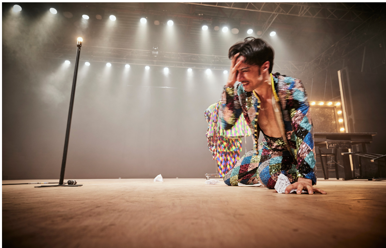
Photographie du spectacle Ma Jeunesse exaltée .