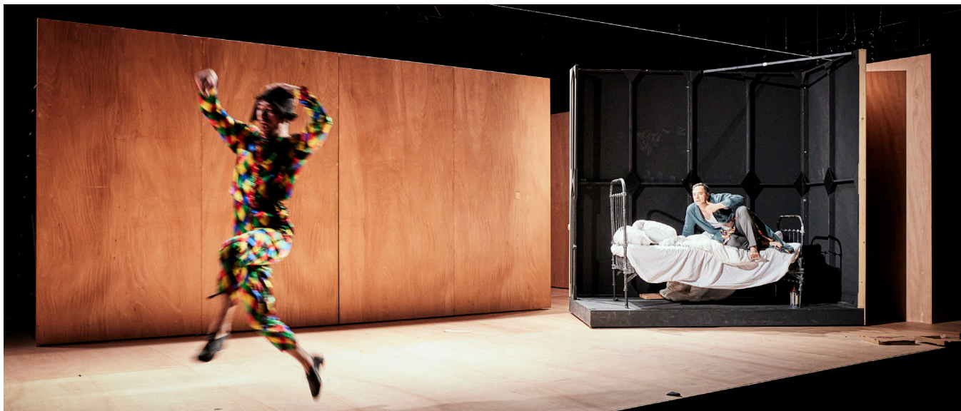
— Photographies du spectacle Ma Jeunesse exaltée . —