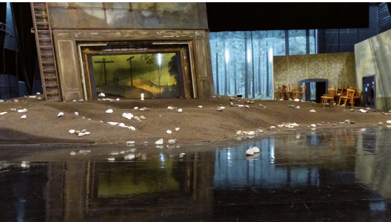
Photo de répétition.

Il peut être formalisé par l'intermédiaire de la grille de scénario (Annexe 2), grille qui n'est pas un modèle en tant que tel. Cette grille peut être distribuée aux élèves en début de séquence.