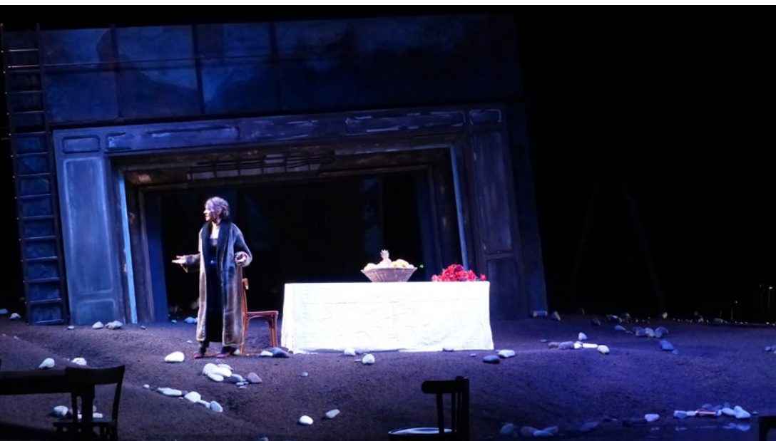
Photo de répétition en costumes.

On demande aux élèves de la classe de faire la liste des couleurs dominantes du spectacle. Les couleurs sont notées au tableau. Pour exprimer son ressenti face à ces couleurs, chaque élève note un mot sur une feuille, un mot qui aura été inspiré par les couleurs du spectacle. On place ensuite les élèves face à face en binômes. Un élève debout « écrit » dans l'air son mot. On explique à l'élève qu'il peut écrire avec son doigt, son coude, son nez ou son épaule. Il doit aussi varier la vitesse et la hauteur de l'écriture. Le deuxième élève dispose d'une feuille (A4 ou A3). Assis par terre, il trace sur cette feuille ce que son camarade dessine dans l'air. Il peut reproduire plusieurs fois la forme. On prévoit de mettre à disposition des élèves des crayons, craies, peinture... aux couleurs du spectacle. Ensuite on inverse les rôles, le dessinateur devient scripteur et le scripteur dessinateur. Les élèves donnent pour finir un titre à leurs productions (le mot de départ ou bien un titre suggéré par le dessin). Ce travail produit une illustration du ressenti des élèves à insérer dans le magazine en page 1. Ce travail peut également se faire en collaboration avec le professeur d'arts plastiques.