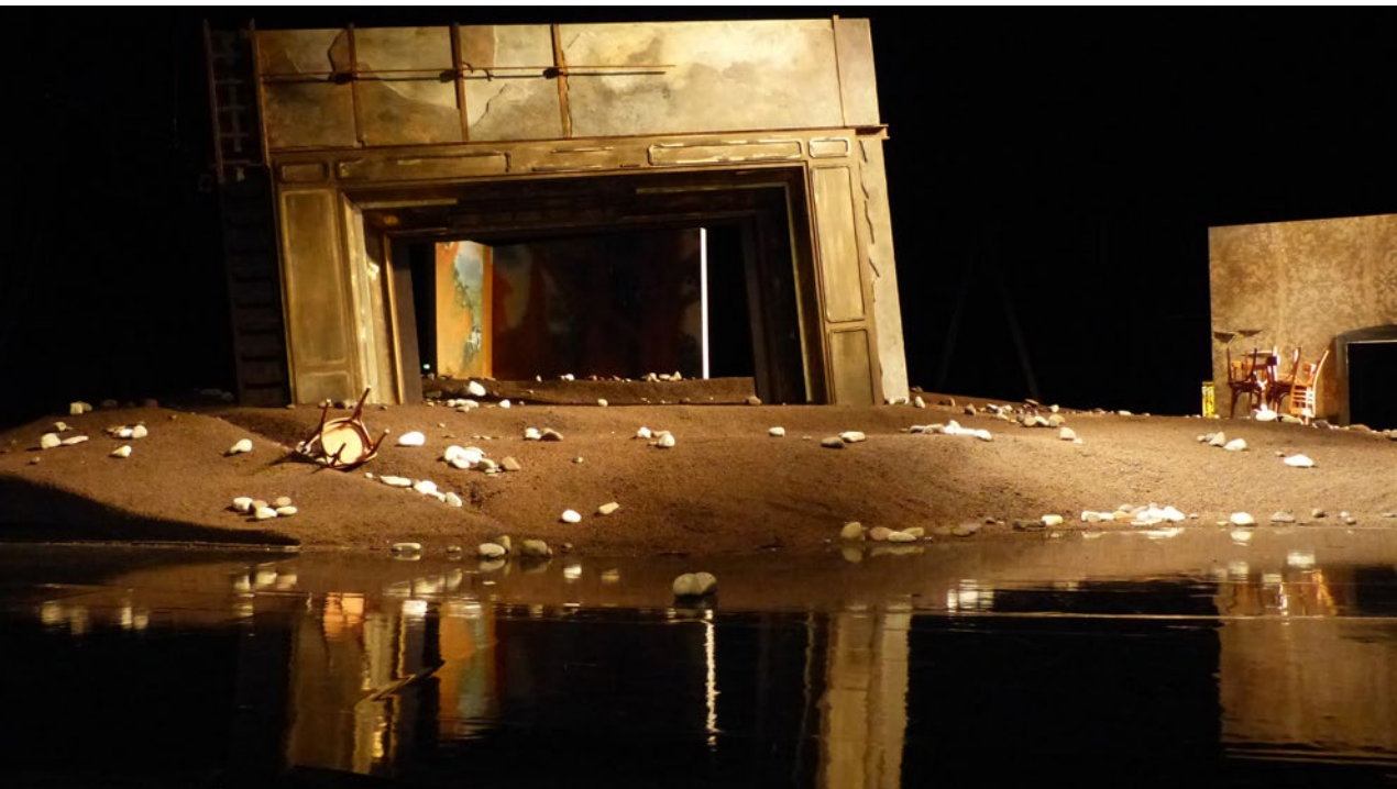
Photo de répétition.