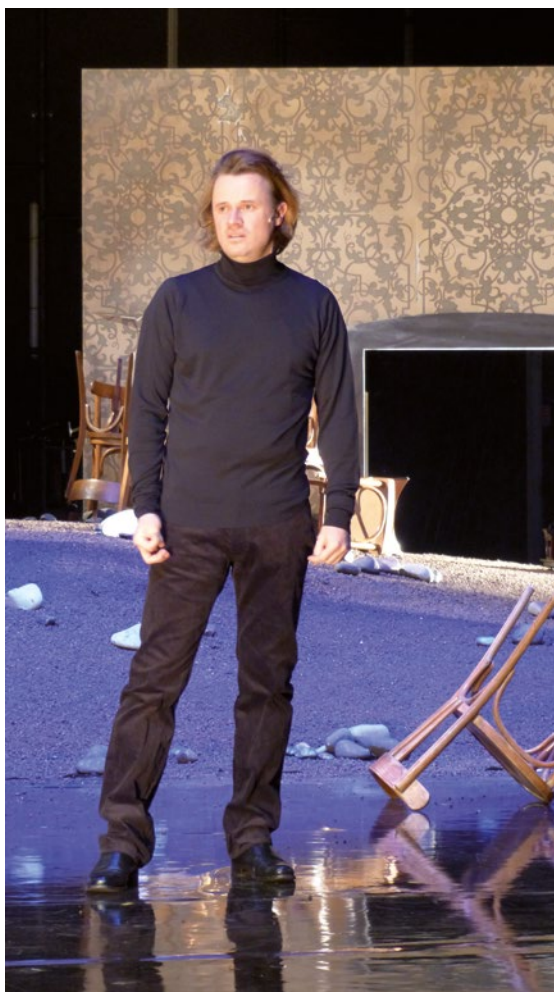
Photos de répétition en costumes.