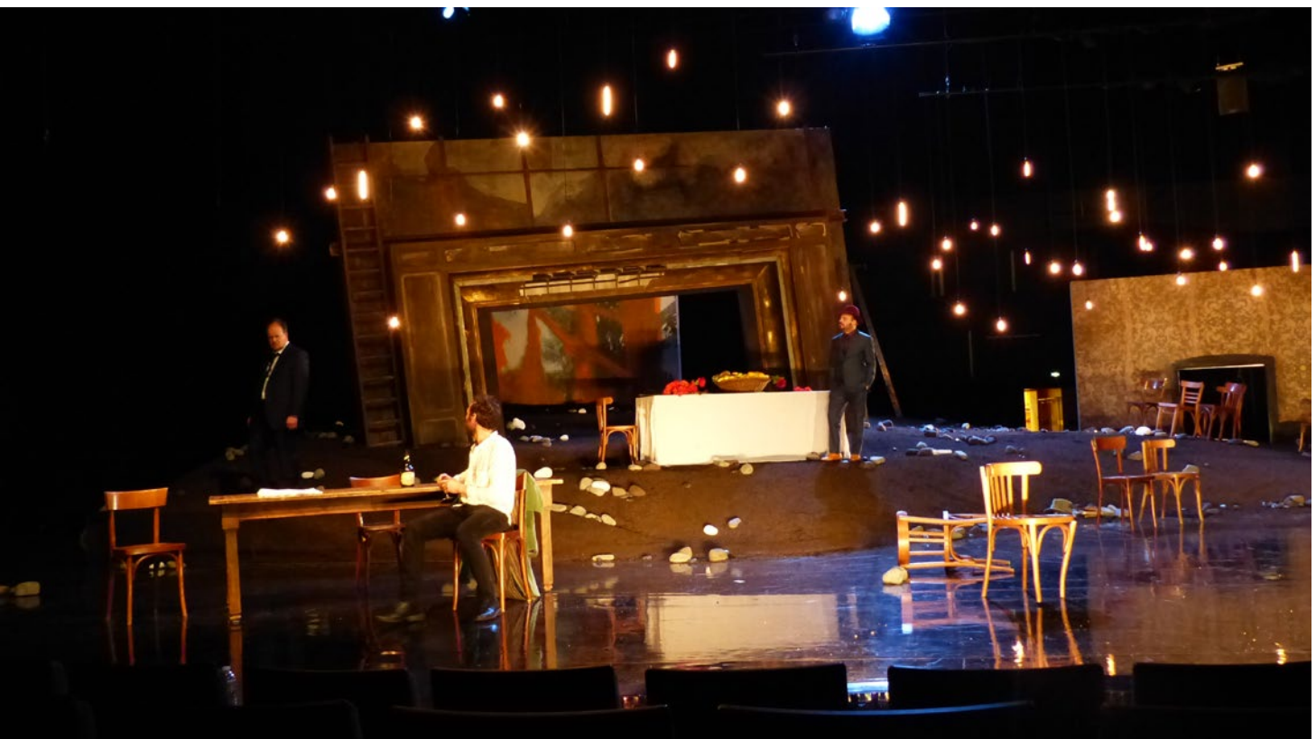
Photo de répétition en costumes.