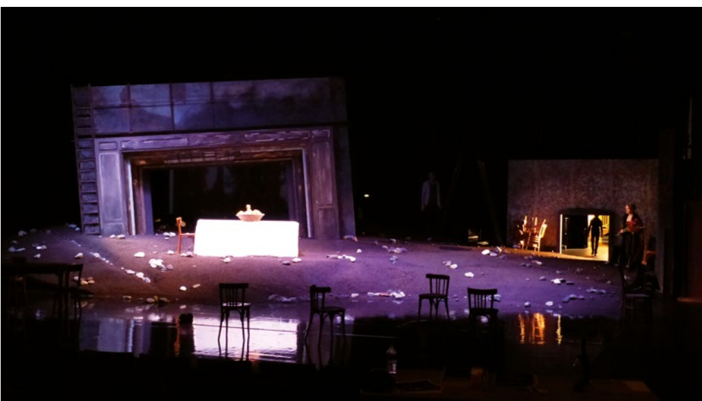
Photos de répétition en costumes.

La classe est divisée en groupes. Chaque groupe prend en charge une des scènes de la pièce et doit en assurer une proposition de mise en scène en réalisant une maquette (on peut aussi imposer la même scène pour tous les groupes ou un extrait de scène). Les élèves devront prendre en compte la lumière, le son, le décor. Ils devront aussi faire une proposition de costumes pour les personnages intervenant dans cette scène. Une variante est possible en réalisant cette mise en scène sous forme de diaporama réalisé avec un logiciel de type PowerPoint. Chaque groupe devra défendre son projet final devant les autres groupes.