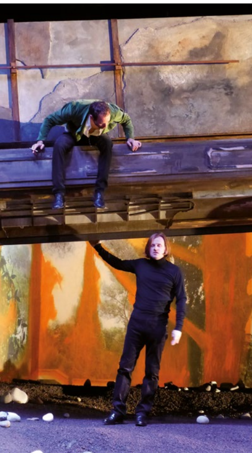
Photos de répétition en costumes.

Demander aux élèves d'écrire une biographie fictive sur un personnage (écriture d'invention). Ils inventent alors un passé, une famille, des qualités et des défauts à ce personnage. Ils utilisent le texte de la pièce pour nourrir leur imaginaire et éviter les contresens. Tout est possible à condition de respecter la cohérence du texte.