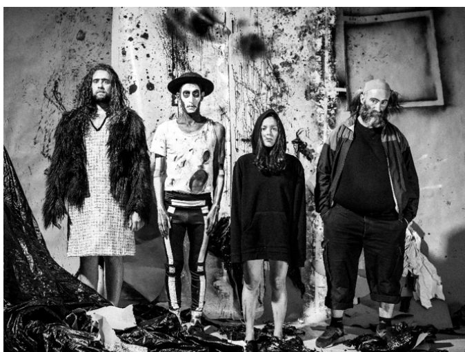
— Photographie de répétition. —

Pour réfléchir à ce point, demander aux élèves de réagir aux questions suivantes, en s'appuyant sur des éléments précis de la représentation. S'aider des photographies ci-dessous et de la liste des costumes donnée en annexe 4. Masculin ou féminin ? Adulte ou enfant ? Jeune ou vieux ? Nu ou habillé ? Humain ou animal ? Humain ou objet ? Unique ou multiple ? Vivant ou mort ? Personnage ou symbole ?