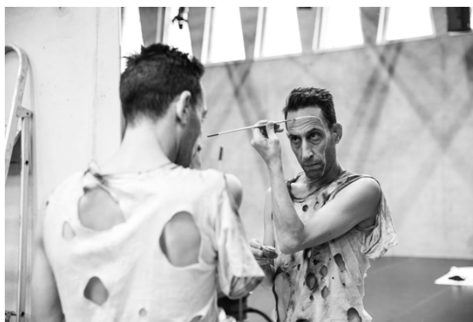
Maquillage de la Mort punk.