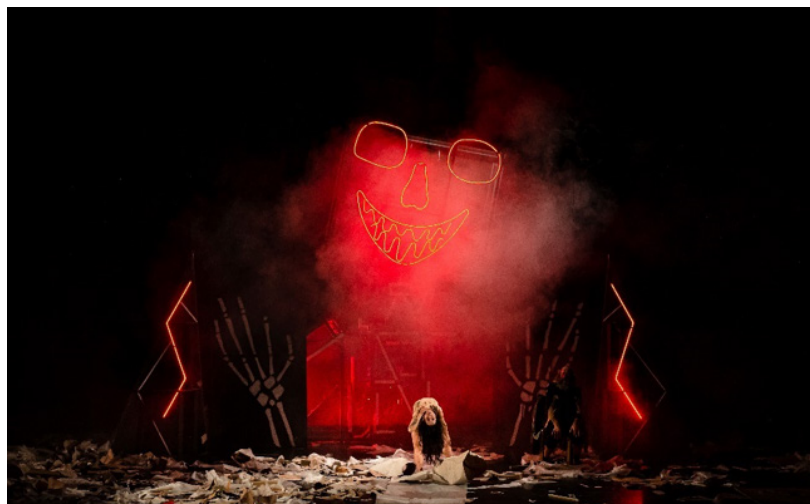
La Mort dominatrice.