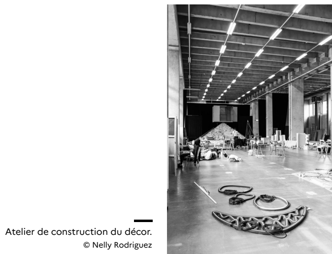
Atelier de construction du décor.