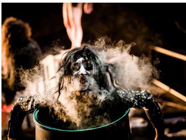
Photographie du spectacle.