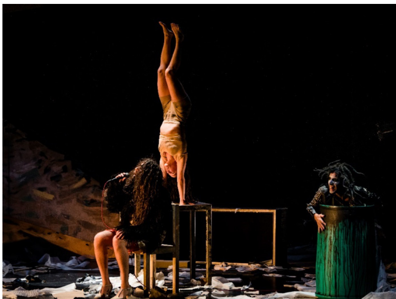
Plusieurs actions simultanées.

Chercher et expliquer comment le spectacle illustre la phrase « Vous qui vivez, il est certain, quoique cela tarde, que vous danserez » (voir annexe 2).