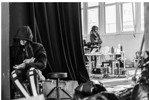
La Mort et son double en coulisse.