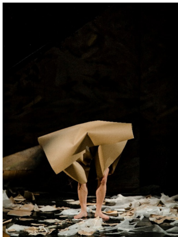
Photographie du spectacle.