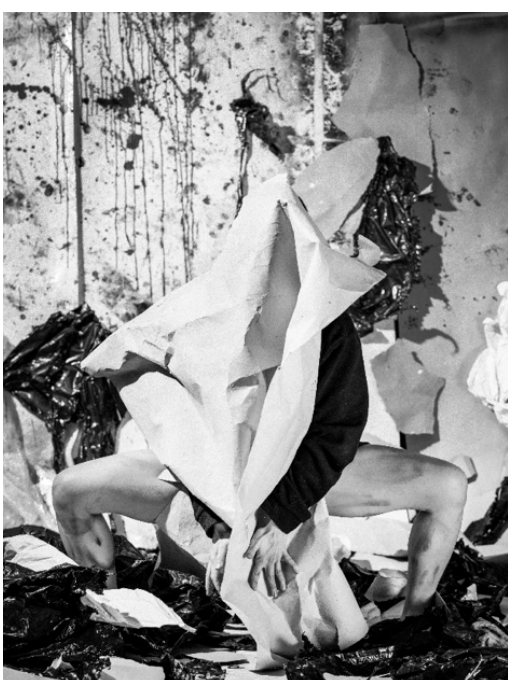
— Photographie de répétition. © Basil Stücheli —