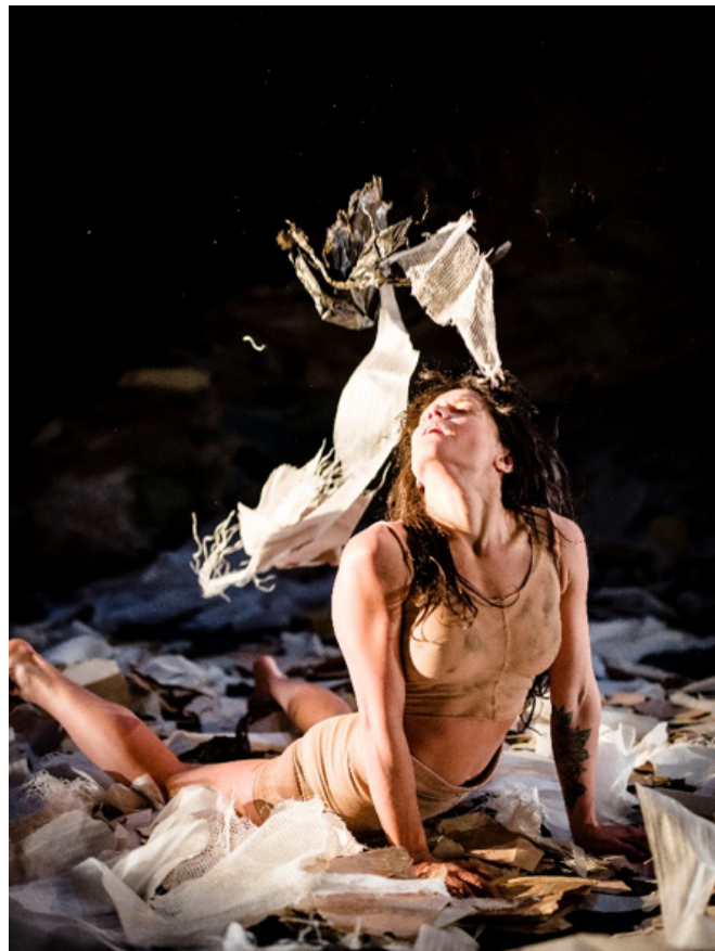
Danse contemporaine : contorsion.