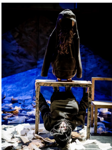
Photographie du spectacle.