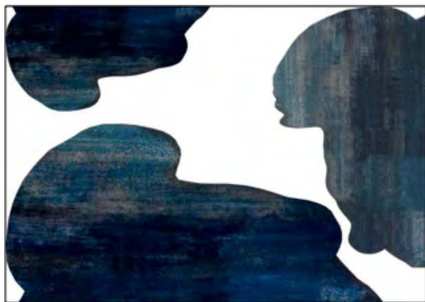
Papiers gouachés extraits d'éléments transformés de l'album