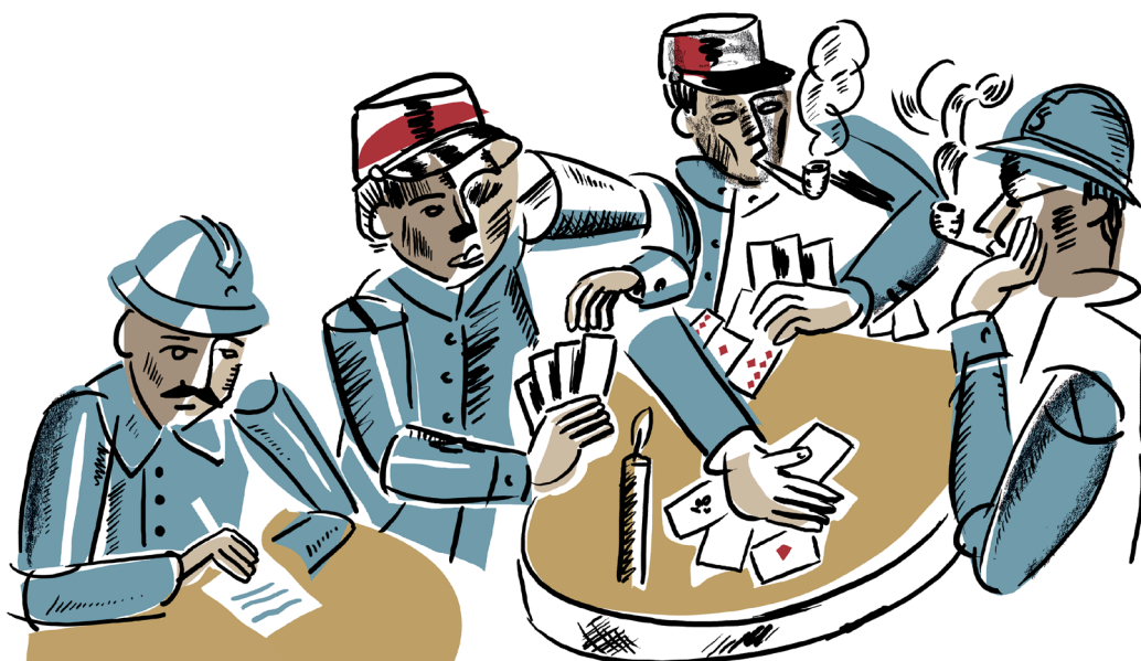
Évolution des formes vers une plus grande géométrisation (voir illustration de l'album).