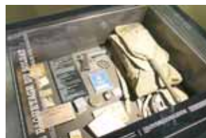
Objets du quotidien des soldats.