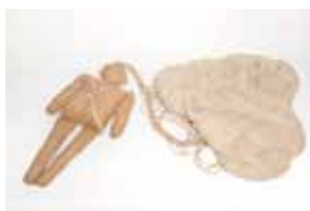
Poupée Rupert qui rappelle l'opération Fortitude.