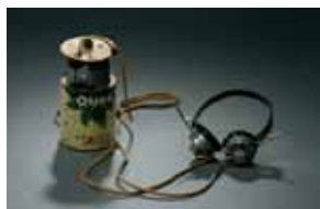
Poste à galène d'André Heintz qui permet d'évoquer le rôle de la Résistance.