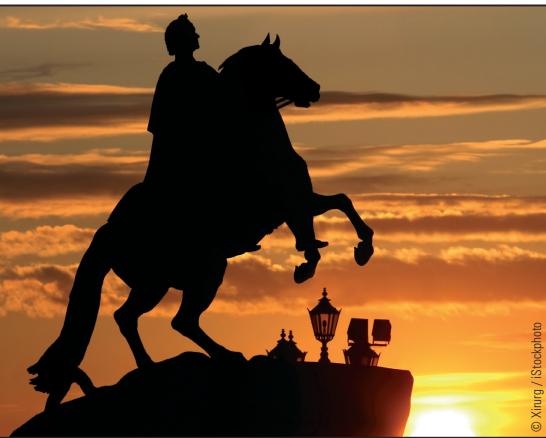
Statue de Pierre le Grand (Saint Pétersbourg)

Cette période de modernisation et d'occidentalisation apparente du pays s'accompagne pourtant d'un durcissement des conditions de vie de la population, notamment des paysans. L'occidentalisation crée en réalité deux Russies : celle des seigneurs occidentalisés et celle de tous les autres. Pour les détracteurs de Pierre le Grand, ses réformes font plus de mal que de bien : l'occidentalisation des élites entraîne le développement d'un sentiment profondément anti-occidental dans le peuple. Les auteurs « eurasiens » vont plus loin et affirment que le règne de Pierre constitue le début de l'occupation germano-romaine de la Russie qui durera jusqu'à la révolution d'Octobre. Dans cette optique, les élites russes sont perçues comme une « administration coloniale » des « civilisateurs occidentaux » mandatés pour surveiller le « peuple sauvage ».