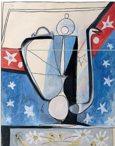
Pablo Picasso, L'aiguière étoilée , musée Picasso, Paris, 1946.