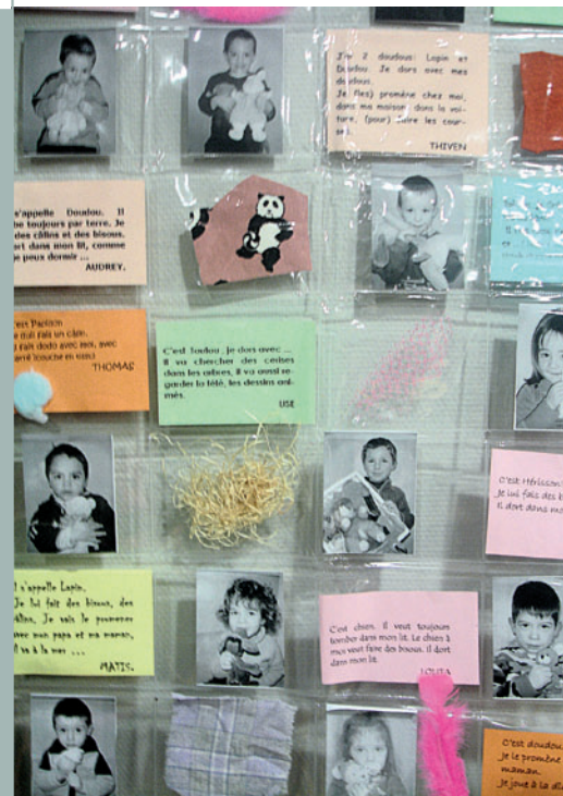
Panneau de pochettes transparentes, PS, école de Moncouthant.