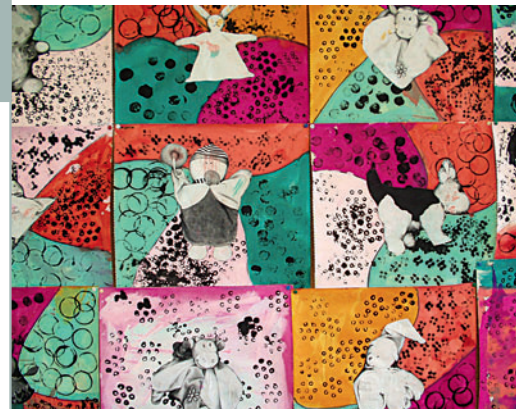
Photocopies de doudous sur fonds d'empreintes de jeux, école maternelle Proust-Chaumette, Saint-Maixent-l'École.