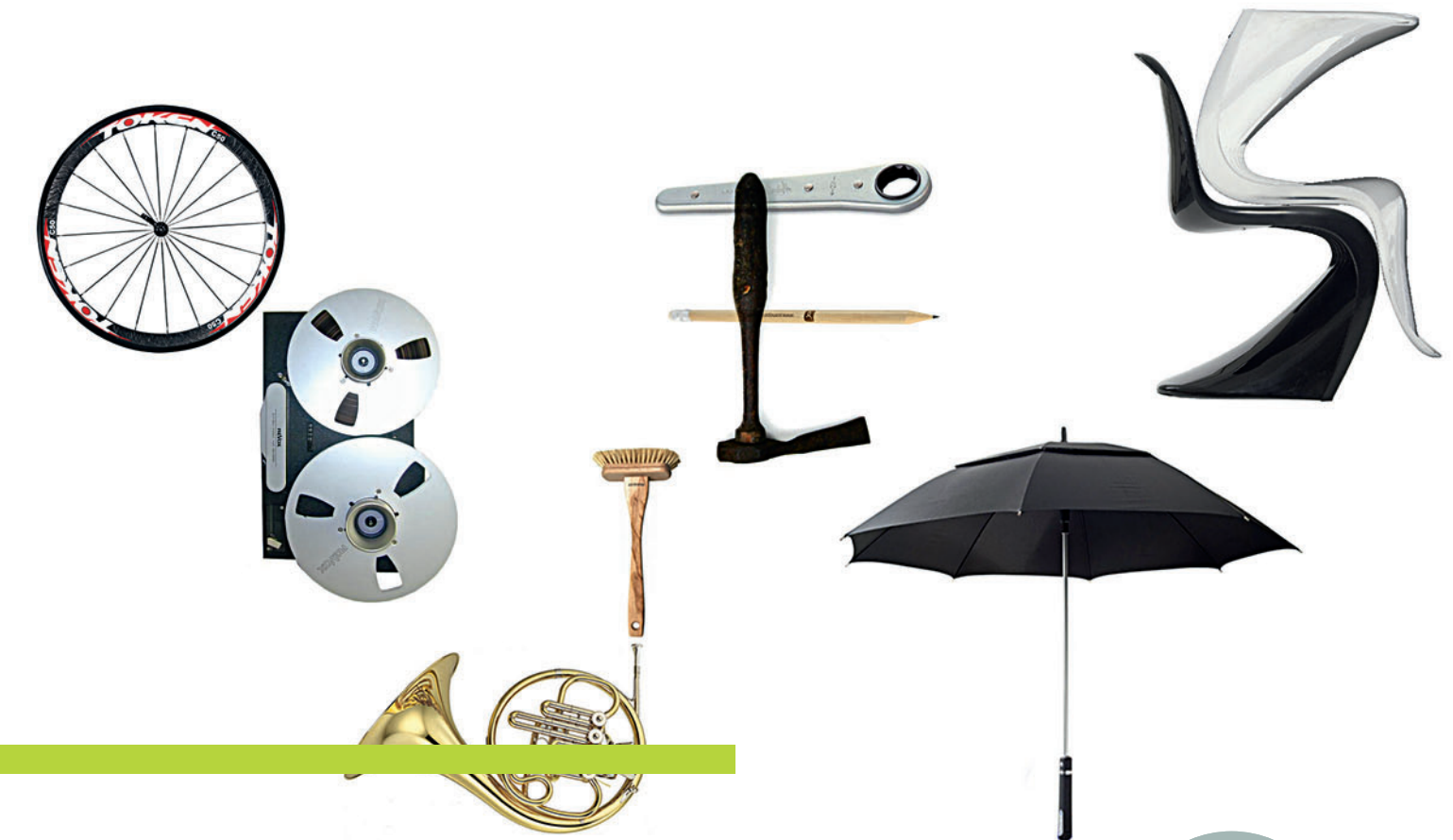
Clément Bacle, Photomontage avec objets, 2008.