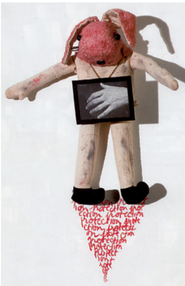
Annette Messenger, Mes petites effigies, détail, 1988.

Les artistes contemporains eux aussi s'emparent des peluches. Dans l'œuvre d'Annette Messenger elles tiennent une place très importante. Les Petites effigies sont pour elle des dépouilles, des petits cadavres de l'enfance auxquels on reste très attaché. 2