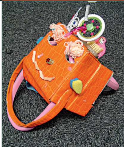
Jouets de petite fille assemblés sous forme de masque, avant d'être vieillis.

La poupée que l'on a serrée si longtemps.