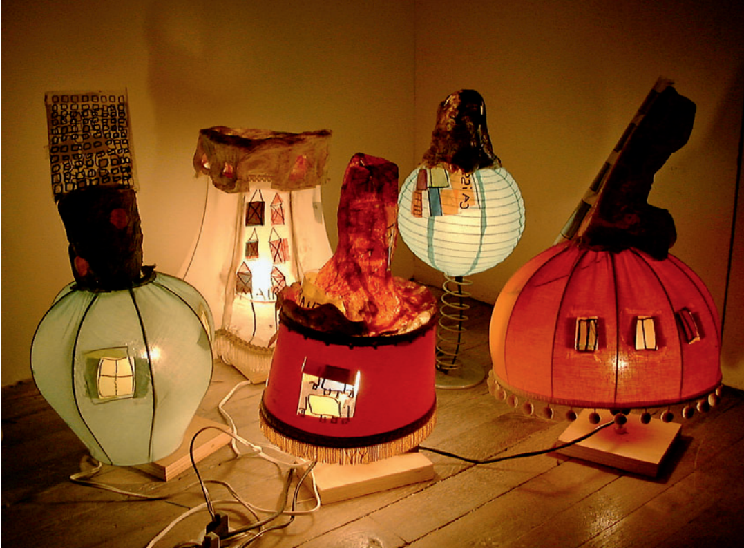
La cité radieuse, des abat-jour comme des immeubles, ateliers IRMAPOC, école d'art de Blois, 2001.

Outre son rôle évident d'aide aux nécessités de l'existence, l'objet remplit d'autres fonctions non moins importantes :