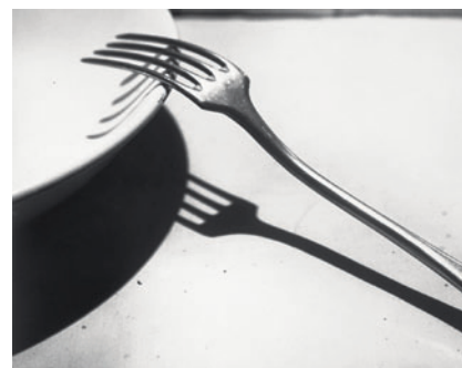
André Kertész, La fourchette, 1928.

C'est dans le contexte économique favorable des années 1920 que débute l'essor de la photographie publicitaire. Les denrées de consommation courante, les produits de luxe (parfums), les accessoires vestimentaires s'élèvent peu à peu au rang d'icônes par la magie des techniques des avant-gardes : photomontages, surimpressions, rayogrammes, gros plans, perspectives renversées... C'est ainsi que La fourchette d'André Kertész, exposée au 1 er Salon des Indépendants en 1928, devient ensuite publicité pour des couverts.