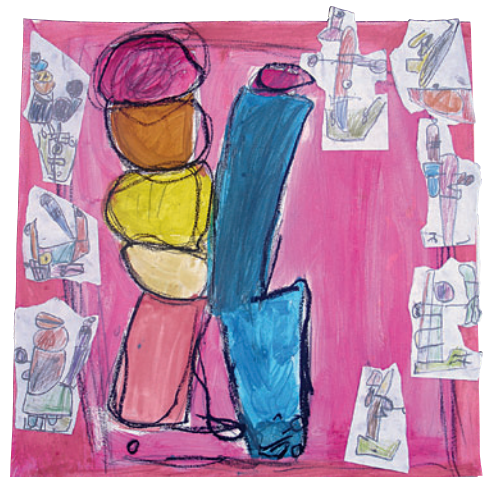
Dessins de microscopes mis en couleurs, CE1, école des Brizeaux, Niort.