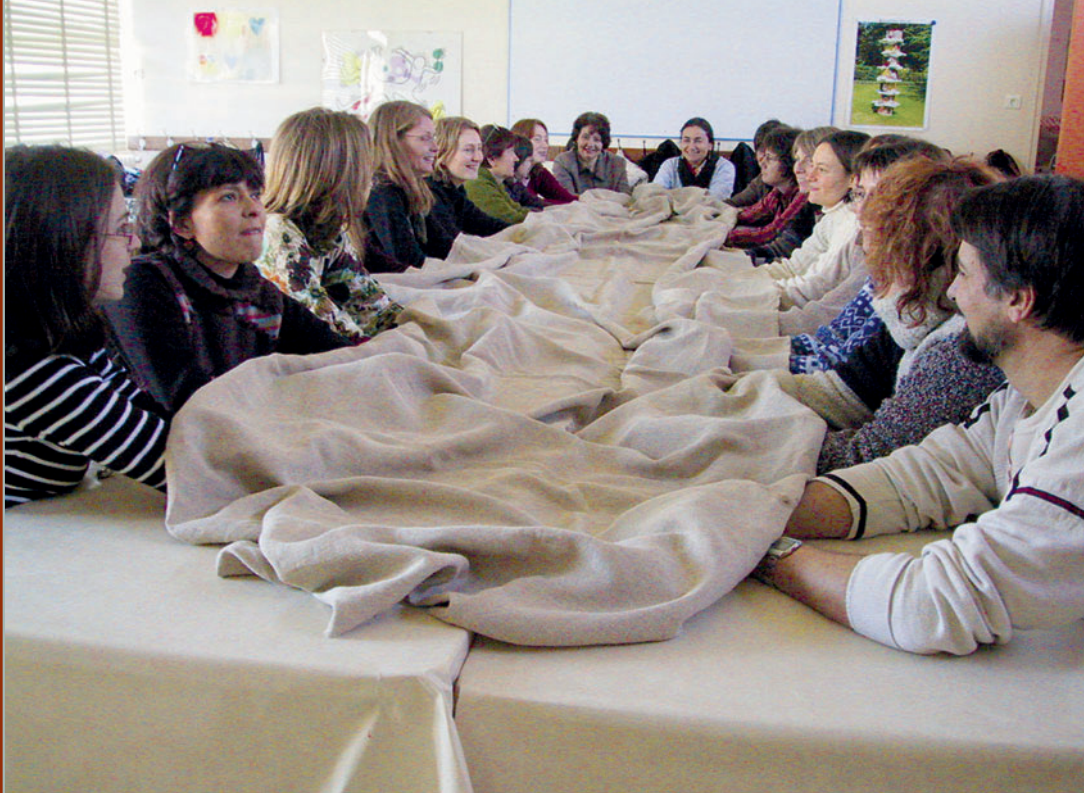
Stage de formation continue, Niort, 2006.

Les civilisations se manifestent par leurs objets, leurs outils, le bazar de leur quotidien. L'archéologie s'appuie (entre autres) sur la découverte d'objets, indices qui nous éclairent sur le passé. L'objet est un élément de notre culture depuis la nuit des temps, et il suffirait de dresser l'inventaire de ses objets personnels pour obtenir le portrait d'un groupe social. L'industrialisation a multiplié et banalisé les objets. Aujourd'hui nous sommes comme doublés d'objets qui prolongent nos gestes, accroissent nos possibilités motrices et visuelles.