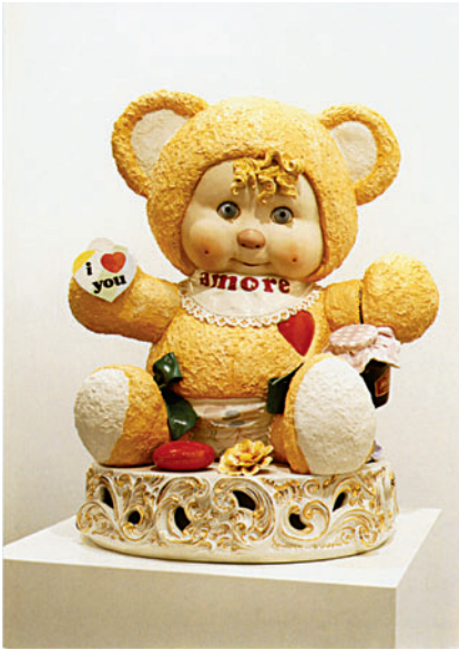
Jeff Koons, Amore, 1988.