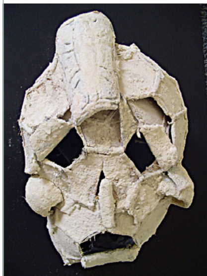
Projet Archéologie et art contemporain, école de Romans.