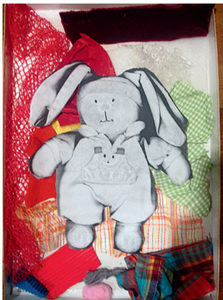
Photocopies mises en valeur dans des boîtes de jouets de Noël, remplies de tissus doux, PS, école de Moncouthant.