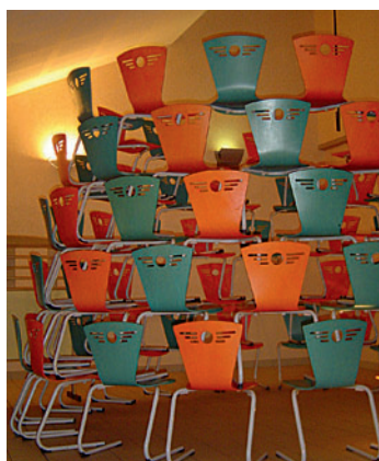
Pyramide de chaises de la cantine, Exposition Les chaises assiègent Mougou, 2006.